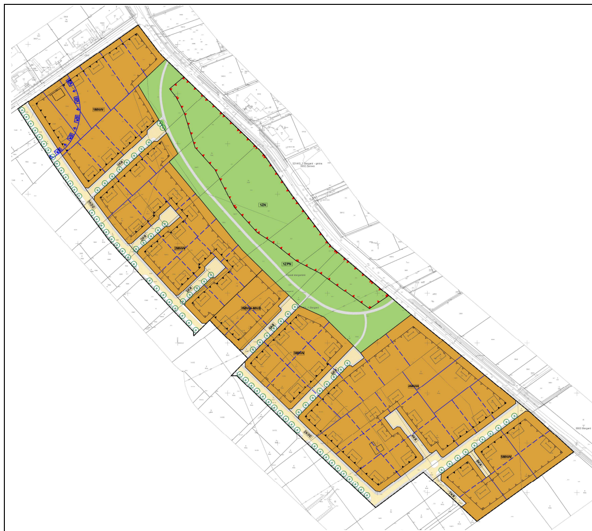
Ilustracja 2 Rysunek projektu planu miejscowego