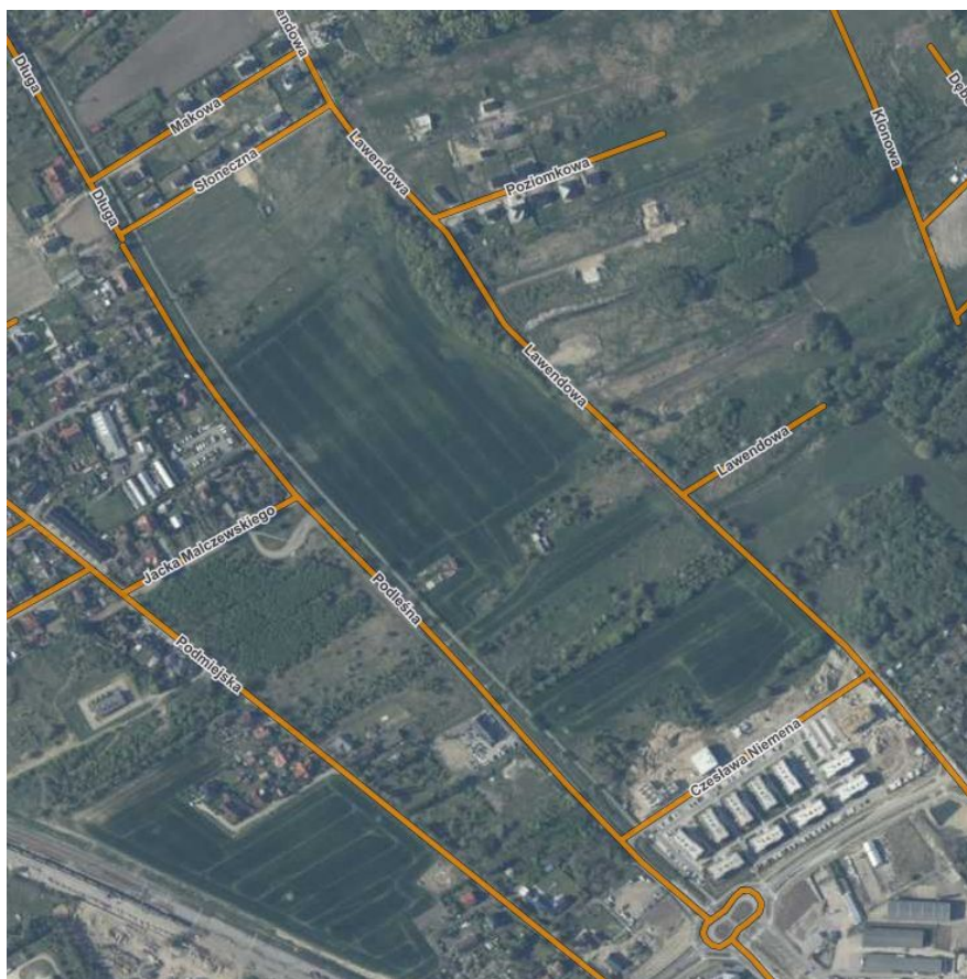
Ilustracja 3 Położenie analizowanego obszaru na terenie miasta

Teren opracowania jest płaski, wysokości bezwzględne wahają się w granicach 20,6 - 25 m n.p.m. – lekko opada w kierunku północno-wschodnim do doliny rzeki Iny, z lokalnym obniżeniami i wyniesieniami.