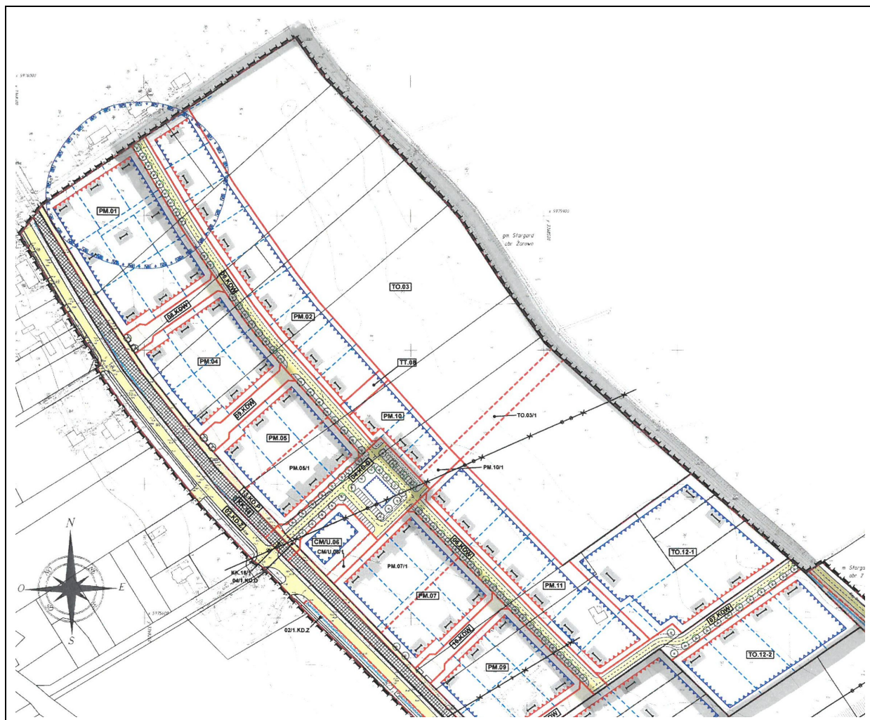
Ilustracja 1 Wyrz z obowiązującego planu miejscowego