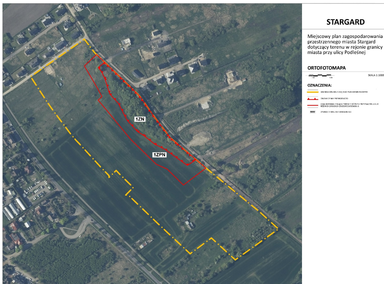
Ilustracja 5 Lokalizacja siedlisk Natura 2000: *91E0 oraz 6430, oznaczona 1ZN wraz ze strefą ochronną 1ZPN i granicami terenu objętego projektem planu miejscowego na tle granic na tle ortofotomapy z zasobu Urzędu Miejskiego w Stargardzie

W projekcie planu miejscowego zagospodarowania przestrzennego uwzględniono wyniki inwentaryzacji przyrodniczej oraz opracowania ekofizjograficznego wyznaczając teren 1ZN – obszar cenny przyrodniczo wraz ze strefą ochronną - 1ZPN, ustalono także warunki ochrony terenów. Plan nie przesądza formy ochrony terenu, wynikającej z ustawy o ochronie przyrody, gdyż może to nastąpić w odrębnej procedurze prawnej.