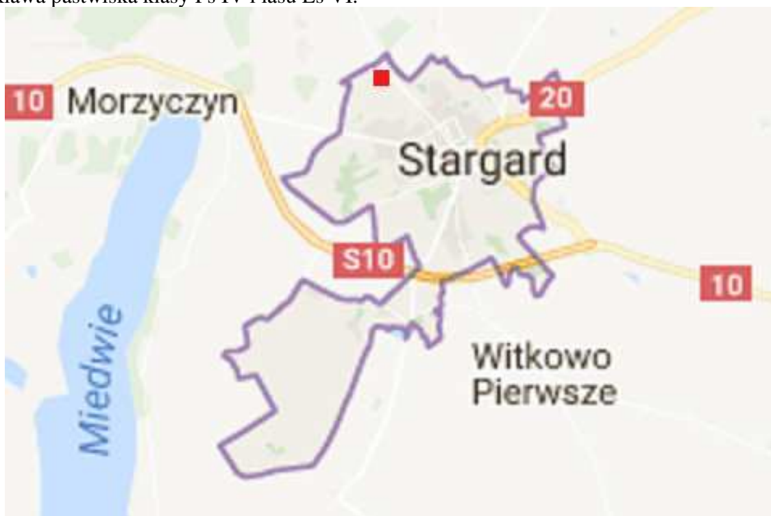
Ryc.1. Orientacyjne położenie obszaru opracowania

Ponadto na wskazanym obszarze opracowania znajduje się w części środkowej Osiedle im. W. Kossaka z zabudową jedno- i dwurodzinną, miejscami usługową. Na pozostałym obszarze głównie w części północnej oraz miejscami w części środkowej występują grunty orne o bonitacji RIIB, RIVa, RIVb i RV oraz znajduje się niewielka enklawa pastwiska klasy Ps IV i lasu Ls VI.